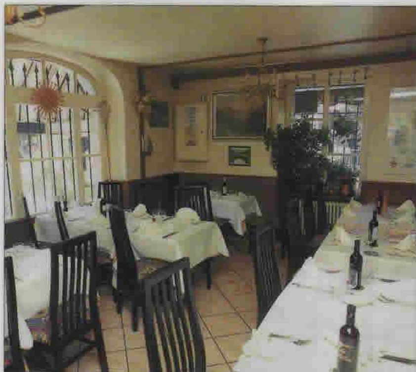
Ambiance authentique dans les restaurants et la salle de banquet au premier étage: «l'italianità» à l'état pur dans le restaurant «Al Castellino» à Perly.