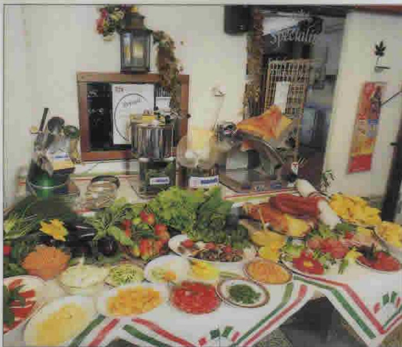
Grand et riche buffet de hors-d'œuvre, de légumes et de salades sur la terrasse du Ristorante «Al Castellino»: à l'arrière-plan, les indispensables appareils de cuisine de la maison Brunner SA (de g. à dr.): la trancheuse de légumes, de fromages et de fruits «Anliker», le cutter «Proficut» et la machine à charcuterie.